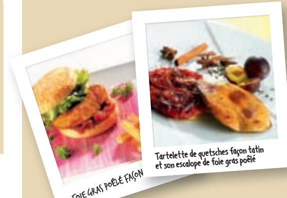
FOIE GRAS POËLÉ FAÇON