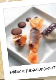
BONBONS DE FOIE GRAS AU CHOCOLAT

Envoyez-la par mail: info@lucien-doriath.fr ou par courrier: Lucien Doriath SA, 30 route de Molsheim, 67120 Soultz-les-bains