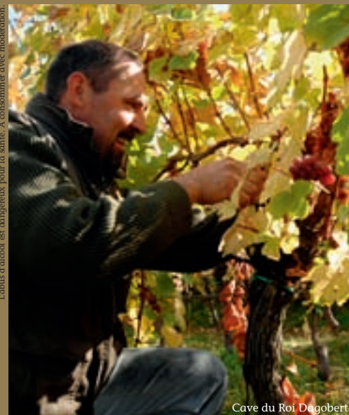
Cave du Roi Dagobert

Les vendredis 4 novembre, 2 décembre, 3 février et 3 mars, soirées œnologie. Les viticulteurs de la cave du Roi Dagobert vous invitent à déguster une sélection de leurs meilleurs crus.